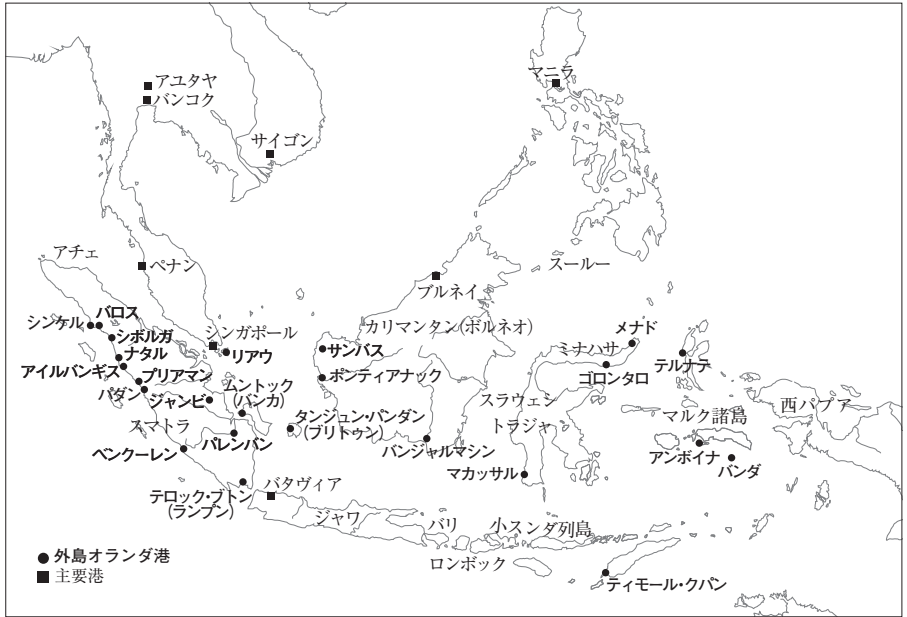
図1 19世紀半ばの島嶼部東南アジアの主要港と外島オランダ港