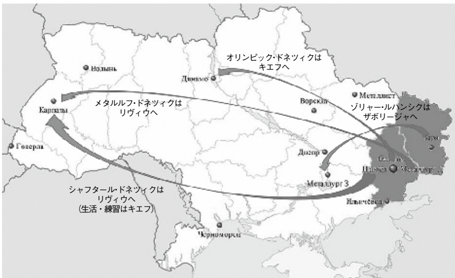
図3 ドンバス各クラブのホームゲーム代替開催地

他方、内戦の舞台となってしまったドンバスのドネツィク州とルハンシク州には、二〇一四/一五シーズンのプレミア参加クラブが五チームもある。当然、現状では地元でのホームゲーム開催が不可能ということで、同季については各クラブが代替の開催地を決めた(すでに政府軍によって解放されているマリウポリ市のイリチヴェツィだけは地元